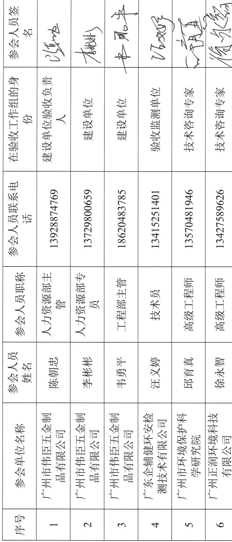
广州市伟臣五金制品有限公司建设项目验收工作组成员名单